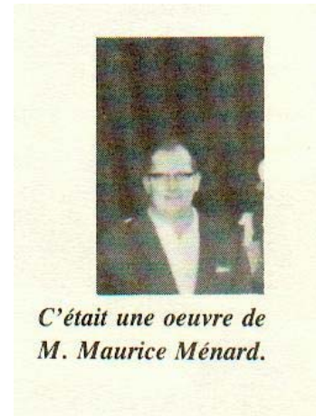
C'était une oeuvre de M. Maurice Ménard.