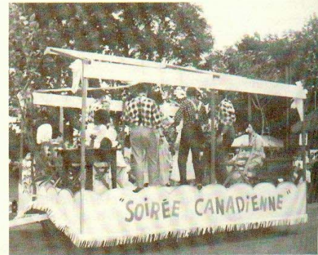
7e char: Les danses d'autrefois.