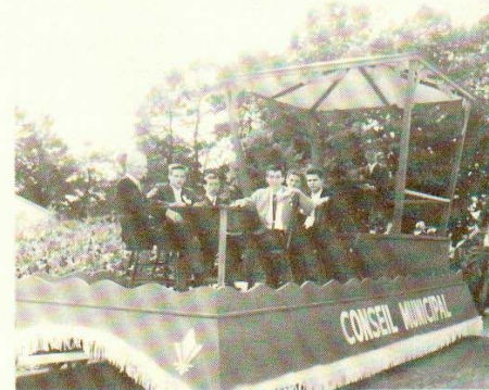
5e char: Le conseil municipal d'autrefois et son greffier.