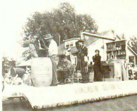
6e char: Le magasin général (le personnel coutumier et l'affichage des prix d'antan).