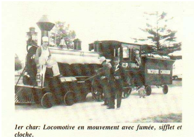
1er char: Locomotive en mouvement avec fumée, sifflet et cloche.