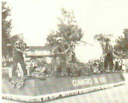
4e char: Le commerce du bois.