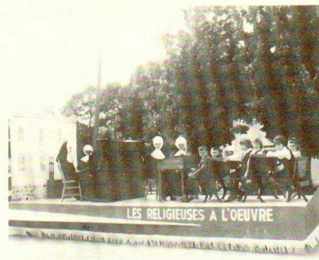
3e char: Les Religieuses de l'Assomption à l'oeuvre.