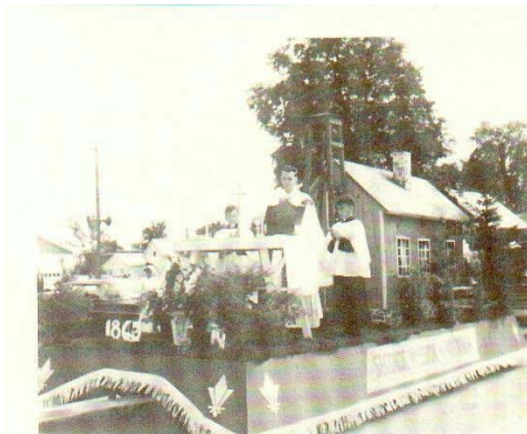
2e char: Première messe.