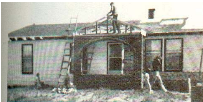
Maison sur la route 139.