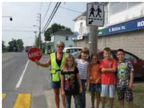
Brigadière intersection Principale et Timmons

enfants d'emprunter les traverses pour écoliers mis à leurs dispositions par la Municipalité et de suivre les consignes et les indications de la brigadière scolaire en fonction et ce, pour leur sécurité.