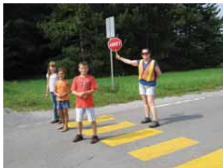
Brigadière intersection Blanchard et Hébert