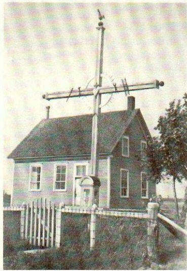
Croix près de l'école du 9 e rang (côté est).

Croix érigée en face de la résidence d'Arthur Parenteau en face de l'école du rang. Il était recommandé d'installer une croix de chemin à proximité de l'école. C'était souvent le lieu de rassemblement pour prier la Vierge. Spécialement au mois de mai.