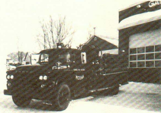
Premier camion à incendie.