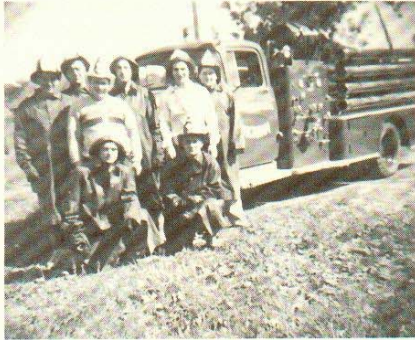
Premier groupe de pompiers.