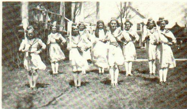
La légende des flots bleus (chanson mimée)

À maintes reprises, la foule enthousiaste a fait vibrer les murs de la vieille salle paroissiale, sous un tonnerre d'applaudissements.