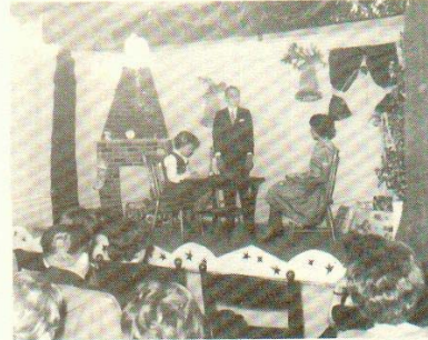
Une scène jouée dans la 1ère salle municipale.