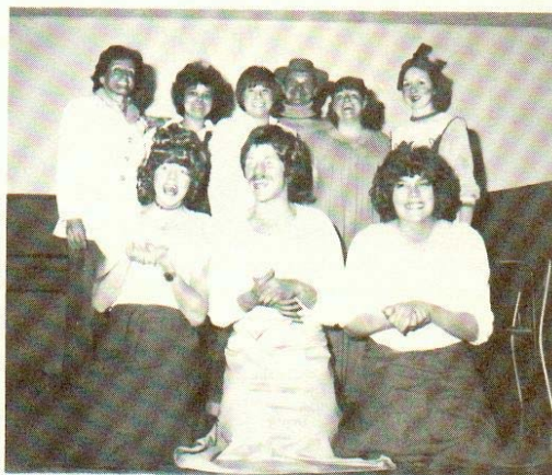
L'oncle en or

Merci pour cette confiance que vous m'avez témoignée.